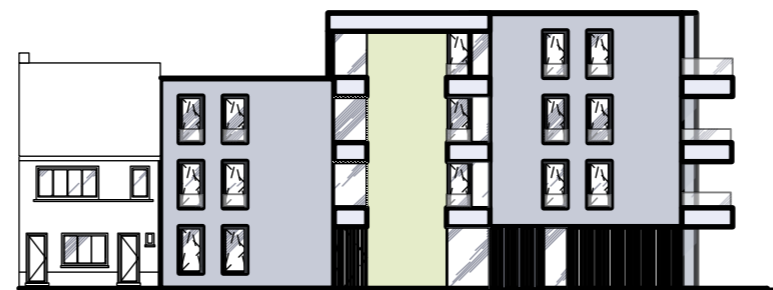
Gevel - Rijmenamseweg