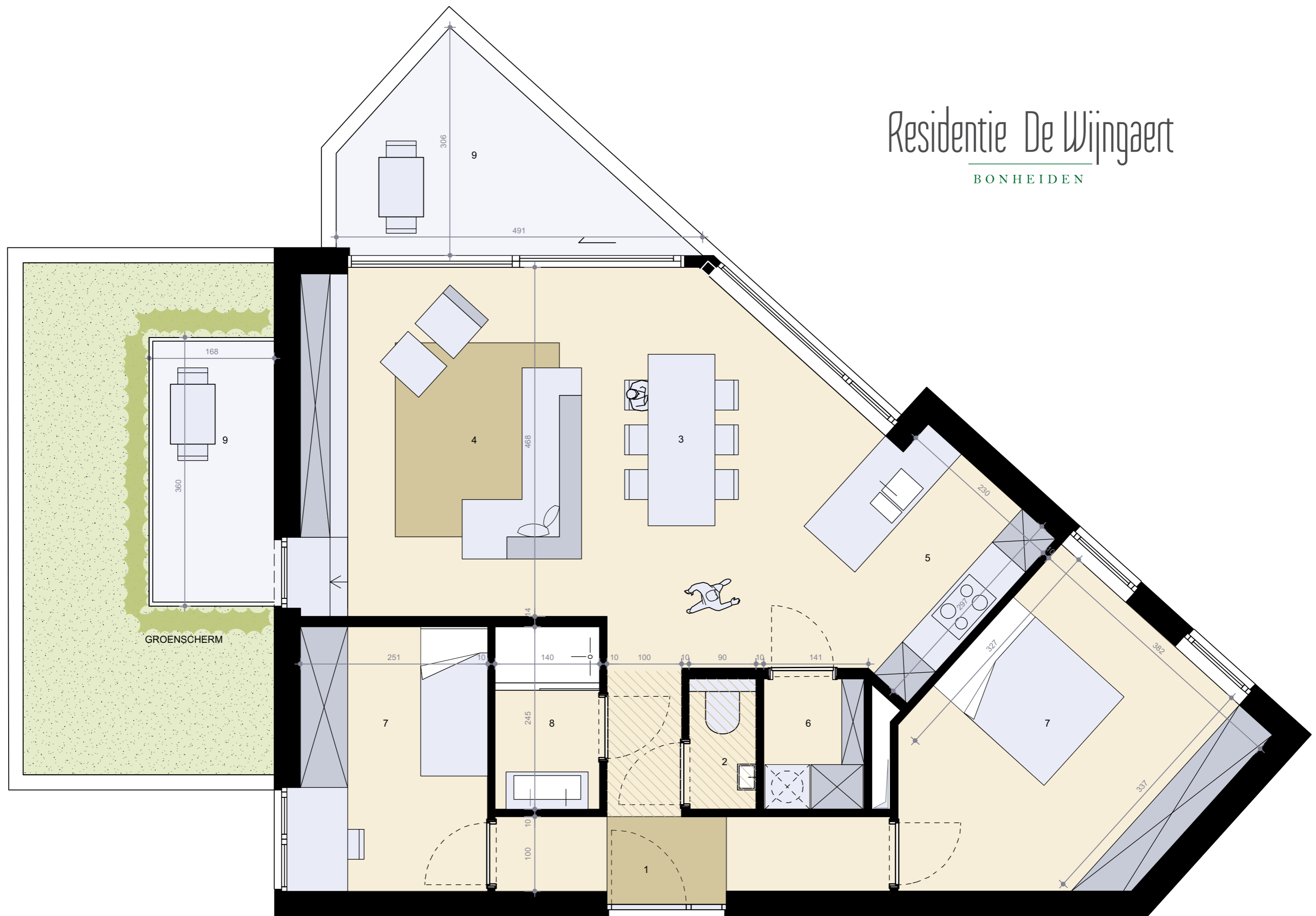
■ Appartement 1.2