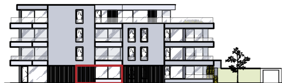
Gevel - Domis De Semerpontlaan