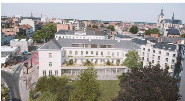
De eerste en de tweede verdieping bieden plek voor acht appartementen.

Zondag 10 september staat het monumentaal gebouw van 10 tot 18 uur open voor het publiek. Je kan ook de imposante zolder bezoeken, waar penthouses worden ingericht. De afdeling Projecten & Monumenten van de stad toont met historische plannen en foto's hoe Mechelen midden negentiende eeuw voor het eerst buiten haar vesten brak.