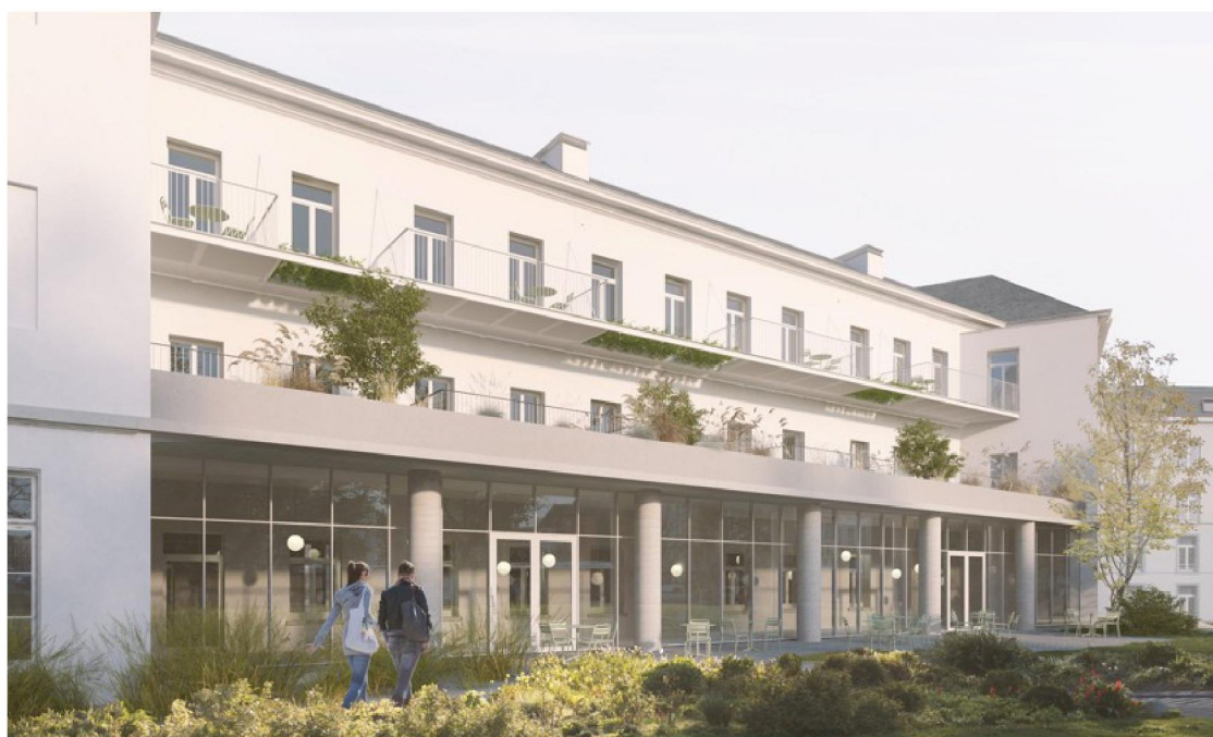
Een impressie van de achtergevel met een orangerie en terrassen voor de appartementen.

plein zal met de tijd ook een stuk autolouwer worden”, vertelt Greet Geypen, schepen van Economie (Open VLD).