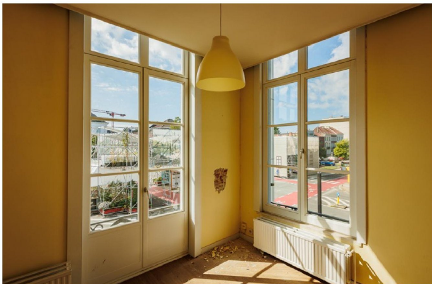
Een zicht op het Kardinaal Mercierplein vanuit het gebouw.