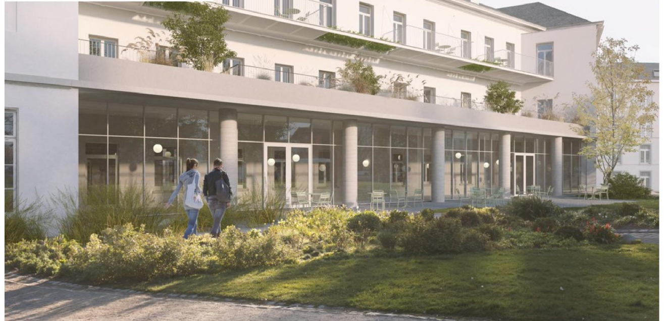
Een impressie van de achtergevel met een orangerie en terrassen voor de appartementen. FOTO A2O ARCHITECTEN

doorgedreven isolatie, een modern ventilatiesysteem en een groendak op de orangerie moeten daartoe bijdragen. “We zijn trots om met deze ontwikkeling mee te kunnen bouwen aan het vernieuwde, in de toekomst groene Kardinaal Mercierplein”, vertelt Cordier.